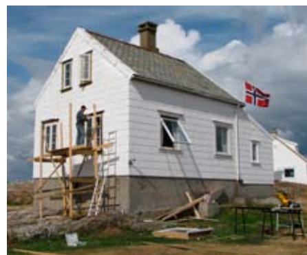
Øverst: Arendal Multiservice i gang skifting av taket på annekset.

Det har også i 2009 vært stor aktivitet med utleie av naustet og hele 1237 overnattinger i boligen og annekset på Store Torungen!